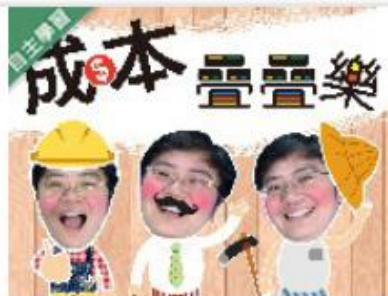
成本疊疊樂 (1091高... 自2020/08/01 ~ 2021/01/31 大葉大學