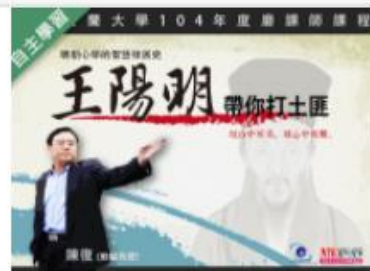
王陽明帶你打土匪：明朝... 自2020/08/01 ~ 2021/01/31 國立宜蘭大學