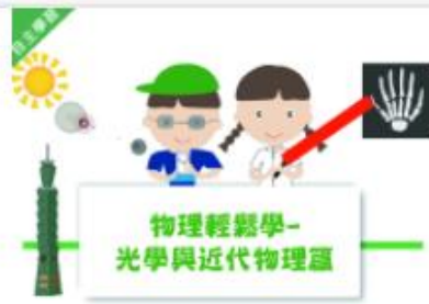
大家一起學物理-光學與... 自2020/08/01 ~ 2021/01/31 國立宜蘭大學