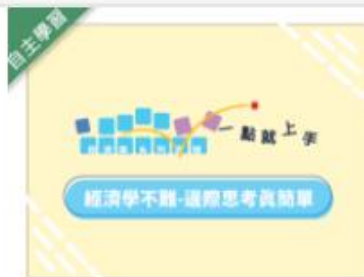
經濟學不難-邊際思考真... 自2020/08/01 ~ 2021/01/31 國立宜蘭大學