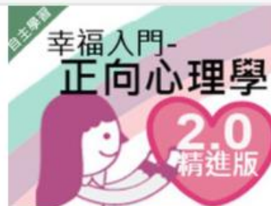
幸福入門 - 正向心理學 ... 自2020/08/01 ~ 2021/01/31 高雄醫學大學