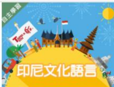
印尼文化語言 (1091... 自2020/08/01 ~ 2021/01/31 國立臺北科技大學