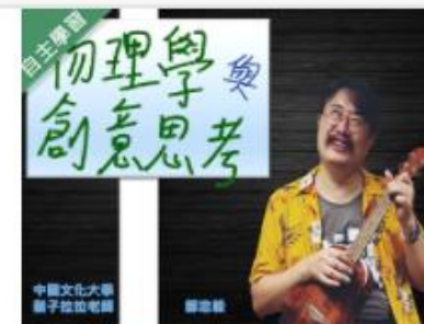
物理學與創意思考 (10... 自2020/08/01 ~ 2021/01/31 中國文化大學