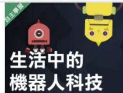
生活中的機器人科技 (... 自2020/08/01 ~ 2021/01/31 國立交通大學