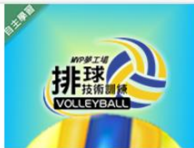
MVP夢工場 - 排球... 自2020/08/01 ~ 2021/01/31 東吳大學