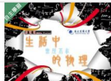
生活中無所不在的物理 (... 自2020/08/01 ~ 2021/01/31 國立宜蘭大學