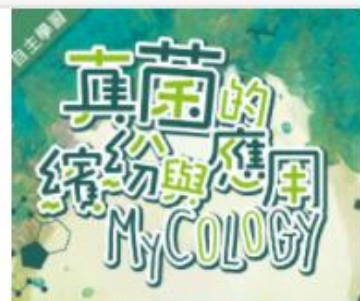
真菌的繽紛與應用 (10... 自2020/08/01 ~ 2021/01/31 東海大學