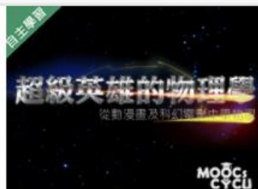
超級英雄的物理學—從動... 自2020/08/01 ~ 2021/01/31 中原大學