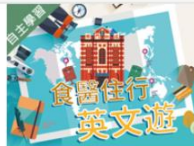
食醫住行英文遊 (109... 自2020/08/01 ~ 2021/01/31 國立臺北科技大學