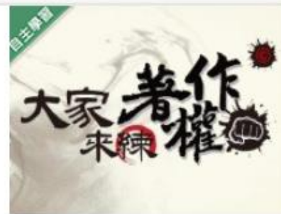
大家來練著作權(權)! ... 自2020/08/01 ~ 2021/01/31 東吳大學