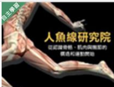
人魚線研究院 - 從認... 自2020/08/01 ~ 2021/01/31 輔仁大學