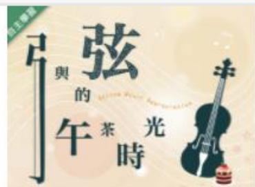
弓與弦的午茶時光 (10... 自2020/08/01 ~ 2021/01/31 中原大學