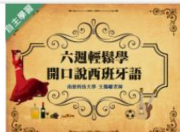
六週輕鬆學、開口說西班牙... 自2020/08/01 ~ 2021/01/31 南臺科技大學