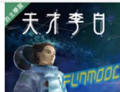
李白(上)：天才李白 (... 自2020/08/01 ~ 2021/01/31 南臺科技大學