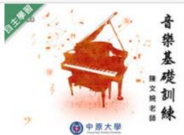
音樂基礎訓練 (1091... 自2020/08/01 ~ 2021/01/31 中原大學