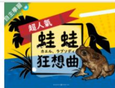
蛙蛙狂想曲 (1091高... 自2020/08/01 ~ 2021/01/31 國立東華大學