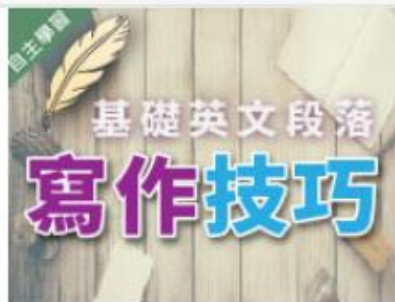
基礎英文段落寫作技巧 (... 自2020/08/01 ~ 2021/01/31 南臺科技大學