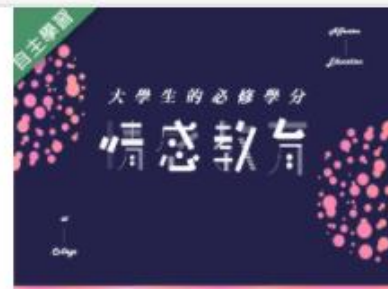
情感教育 (1091高中... 自2020/08/01 ~ 2021/01/31 國立雲林科技大學