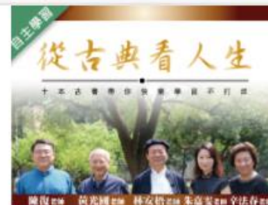
從古典看人生 (1091... 自2020/08/01 ~ 2021/01/31 國立宜蘭大學