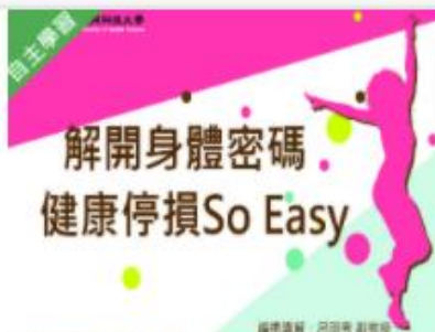
解開身體密碼-健康停損... 自2020/08/01 ~ 2021/01/31 國立高雄科技大學