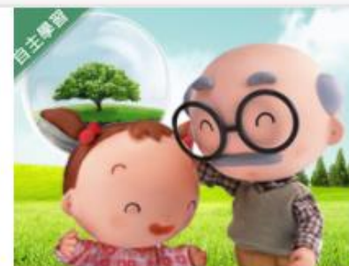
銀髮心理與生活 (109... 自2020/08/01 ~ 2021/01/31 國立交通大學