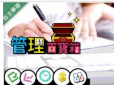
管理百寶箱 (1091高... 自2020/08/01 ~ 2021/01/31 大葉大學