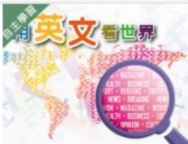
用英文看世界 (1091... 自2020/08/01 ~ 2021/01/31 國立臺北護理健康大學