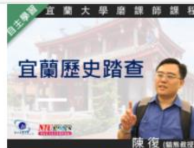
宜蘭歷史踏查 (1091... 自2020/08/01 ~ 2021/01/31 國立宜蘭大學