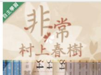
非常村上春樹 (1091... 自2020/08/01 ~ 2021/01/31 淡江大學