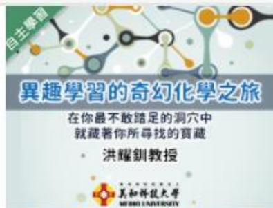
異趣學習的奇幻化學之旅... 自2020/08/01 ~ 2021/01/31 美和科技大學