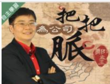
為公司把把脈 (1091... 自2020/08/01 ~ 2021/01/31 大葉大學