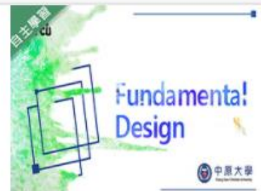
Fundamenta! ... 自2020/08/01 ~ 2021/01/31 中原大學