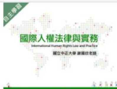
國際人權法律與實務 (... 自2020/08/01 ~ 2021/01/31 國立中正大學