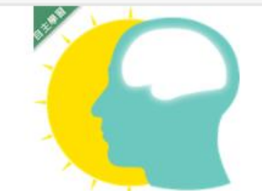
學會學：學習之道 (10... 自2020/08/01 ~ 2021/01/31 國立交通大學