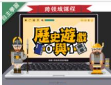
歷史遊戲0與1 (109... 自2020/08/01 ~ 2021/01/31 國立東華大學