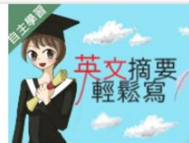
英文摘要輕鬆寫 (109... 自2020/08/01 ~ 2021/01/31 國立臺灣海洋大學