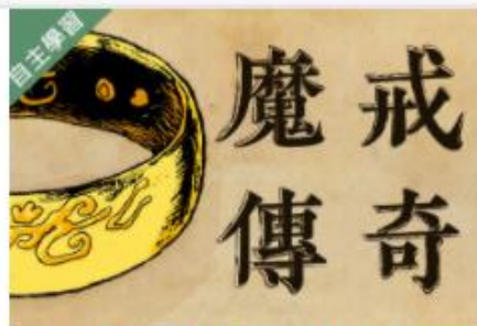
魔法魔法許我一個想像的... 自2020/08/01 ~ 2021/01/31 國立東華大學