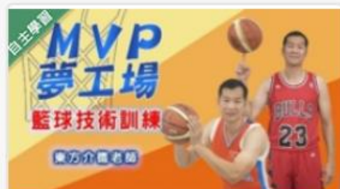
MVP夢工場 - 籃球... 自2020/08/01 ~ 2021/01/31 東吳大學