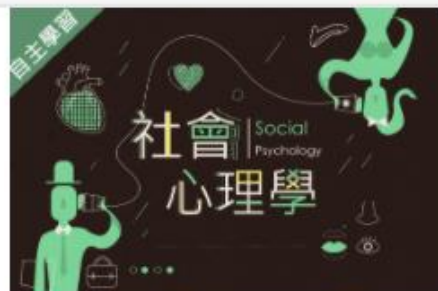
社會心理學 (1091高... 自2020/08/01 ~ 2021/01/31 國立雲林科技大學