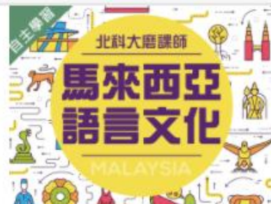
馬來西亞語言文化 (10... 自2020/08/01 ~ 2021/01/31 國立臺北科技大學