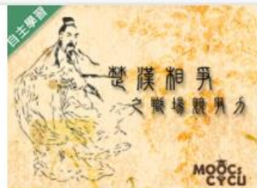
楚漢相爭之職場競爭力 (... 自2020/08/01 ~ 2021/01/31 中原大學