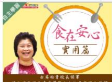
食在安心(實用篇) (... 自2020/08/01 ~ 2021/01/31 國立宜蘭大學