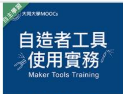
自造者工具使用實務 (... 自2020/08/01 ~ 2021/01/31 大同大學