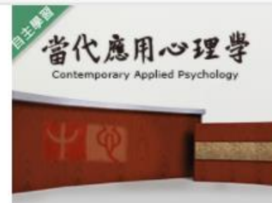
當代應用心理學 (109... 自2020/08/01 ~ 2021/01/31 國立雲林科技大學