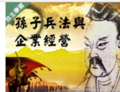
孫子兵法與企業經營 (... 自2020/08/01 ~ 2021/01/31 國立交通大學