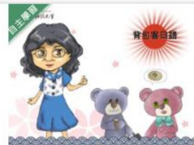
背包客日語 (1091高... 自2020/08/01 ~ 2021/01/31 崑山科技大學