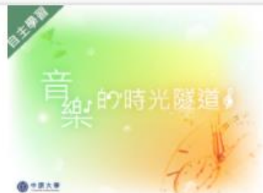
音樂時光隧道 (1091... 自2020/08/01 ~ 2021/01/31 中原大學