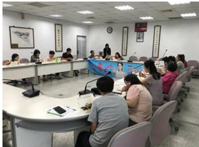
教職員工菸害防制教育宣導