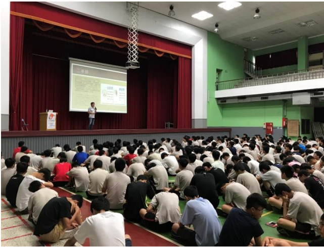
菸(含電子煙)害防制講座照片照片