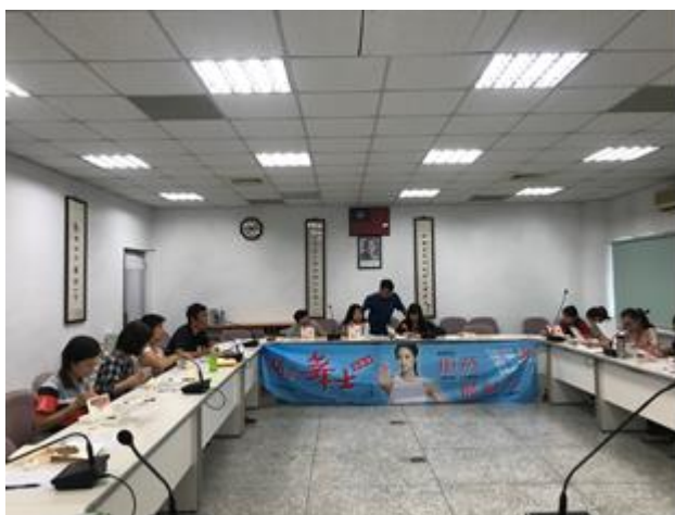
教職員工菸害防制教育宣導