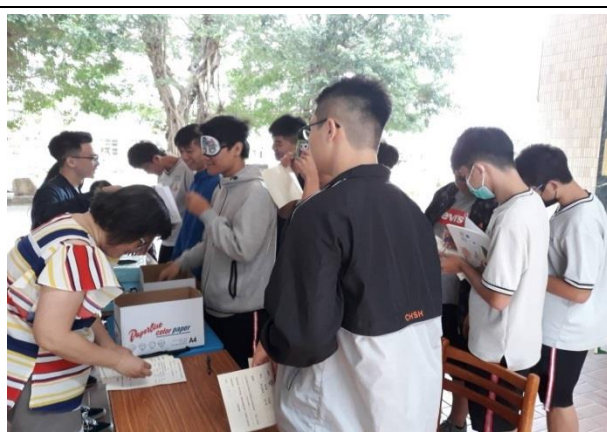
名稱：視力保健闖五關活動