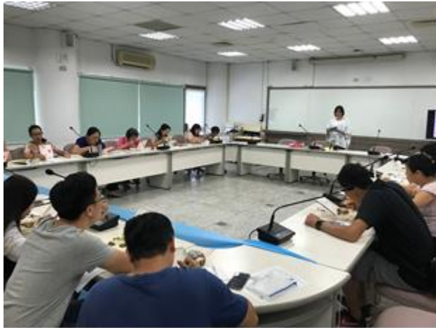
教職員工菸害防制教育宣導