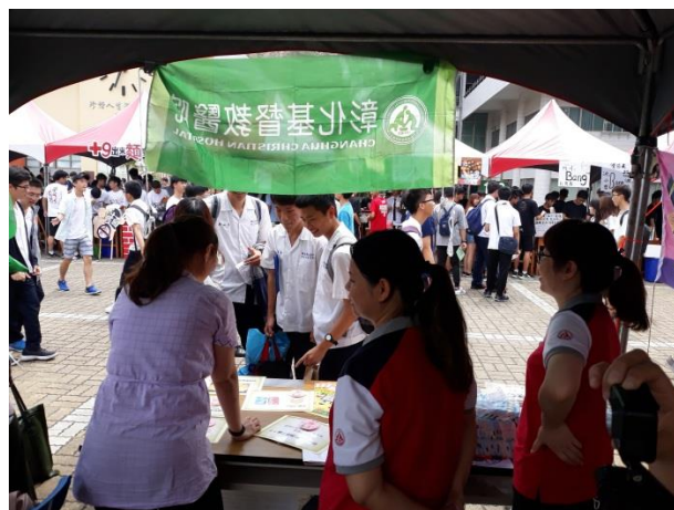
名稱：園遊會結合彰基宣導健康體位