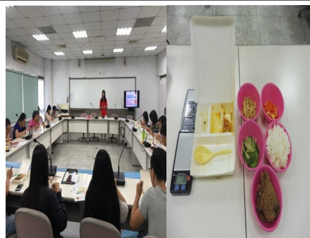
名稱：教職員工『便當熱量大解密』活動