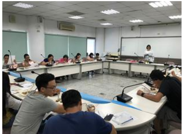
教職員工菸害防制教育宣導