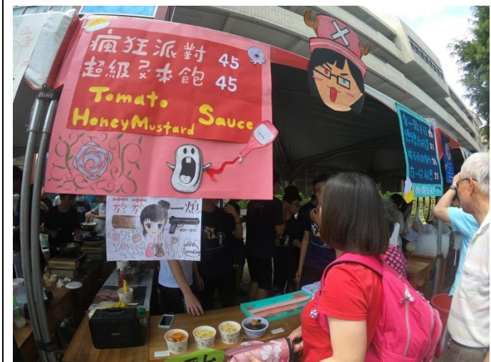
園遊會禁菸標示 Logo 創作競賽得獎班及照片