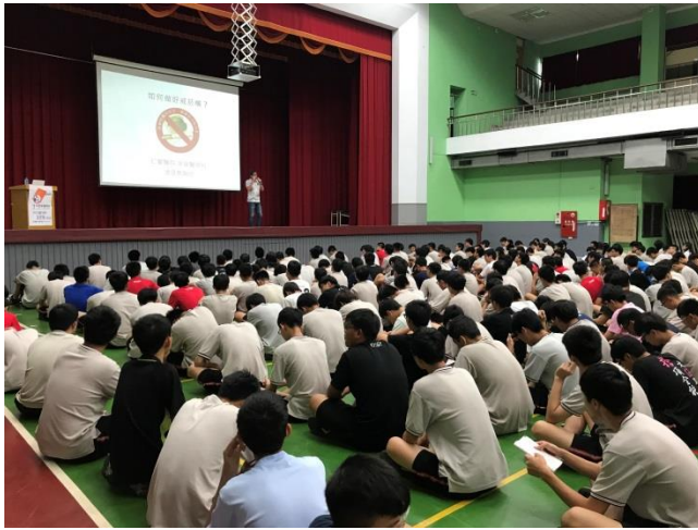
菸(含電子煙)害防制講座照片