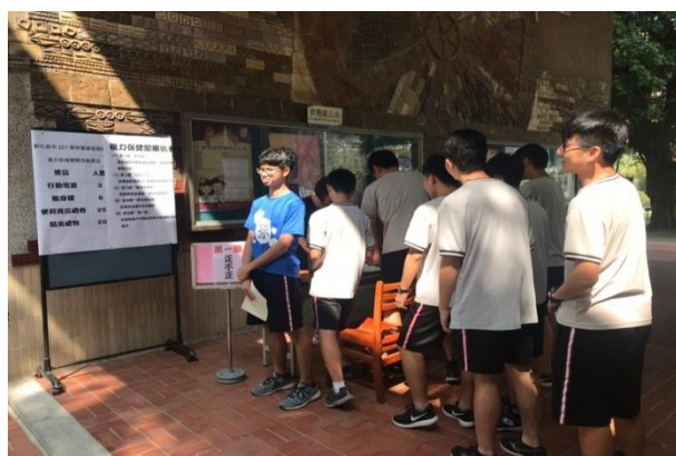
名稱：視力保健闖五關活動