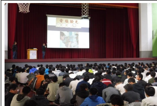
名稱：107. 3. 21 視力保健教育宣導講座