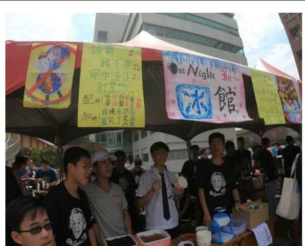
園遊會禁菸標示 Logo 創作競賽得獎班及照片