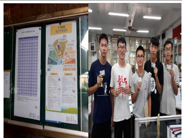
名稱：「健康體位」有獎徵答活動