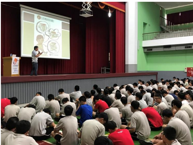
菸(含電子煙)害防制講座照片照片