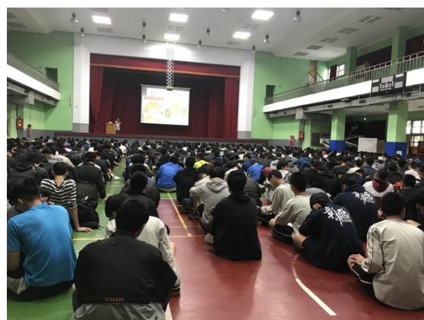
名稱：健康外食技巧營養教育宣導講座