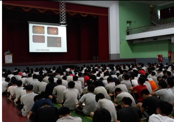
名稱：107. 8. 16 視力保健教育宣導講座