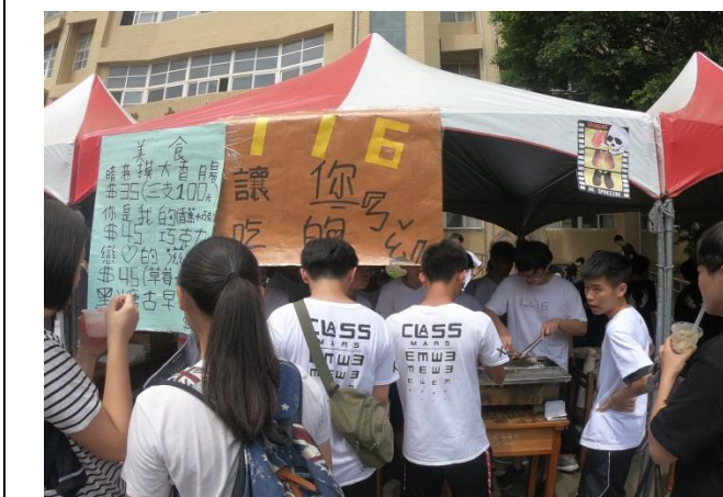
園遊會禁菸標示 Logo 創作競賽得獎班及照片