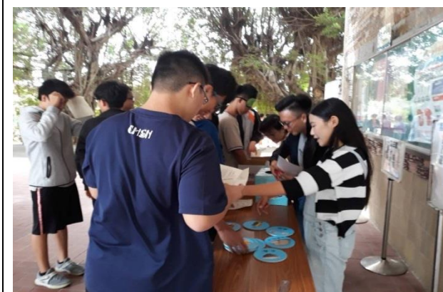
名稱：視力保健闖五關活動