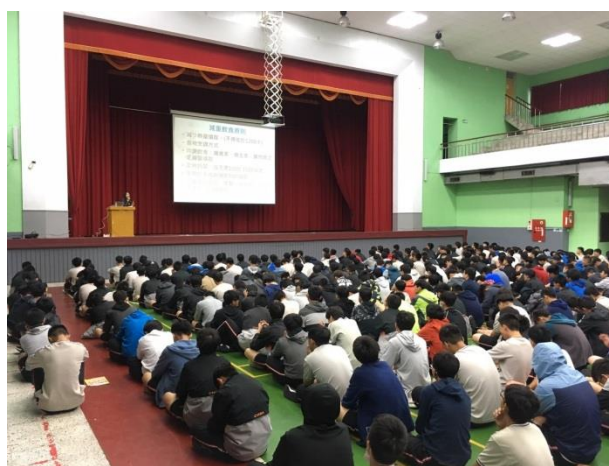
名稱：體位與慢性病的關係宣導講座