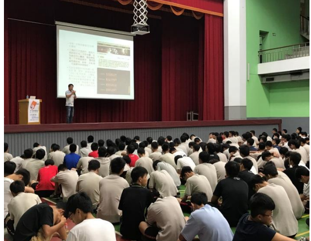
菸(含電子煙)害防制講座照片