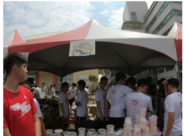
園遊會禁菸標示 Logo 創作競賽得獎班及照片