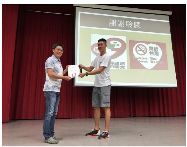
菸(含電子煙)害防制講座照片照片