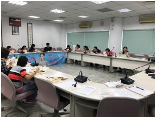
教職員工菸害防制教育宣導