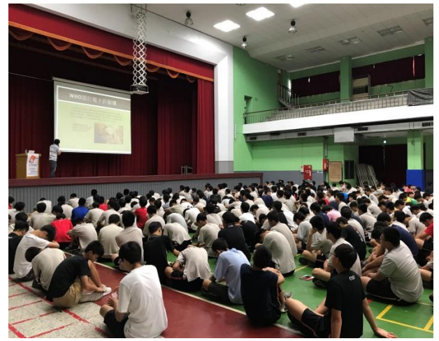
菸(含電子煙)害防制講座照片照片