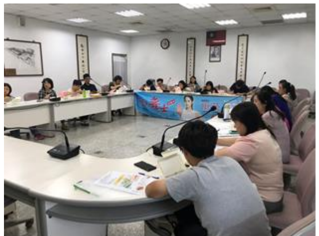
教職員工菸害防制教育宣導