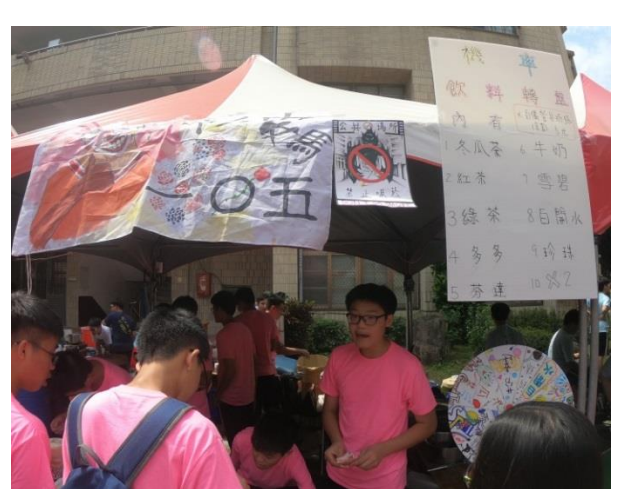
園遊會禁菸標示 Logo 創作競賽得獎班及照片