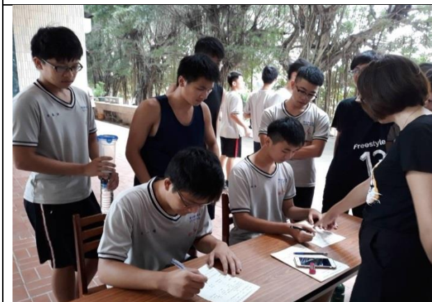
名稱：視力保健闖五關活動