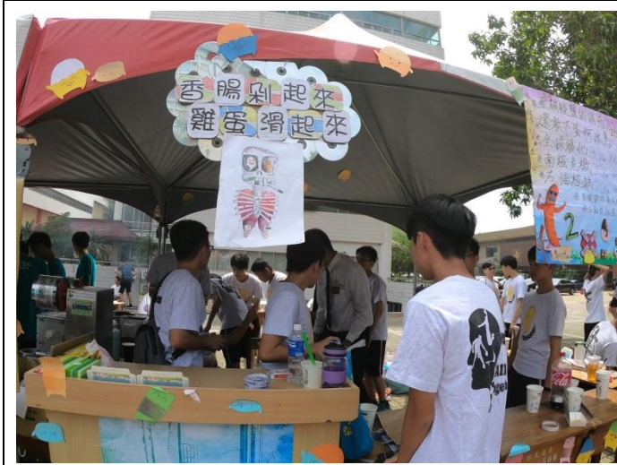
園遊會禁菸標示 Logo 創作競賽得獎班及照片