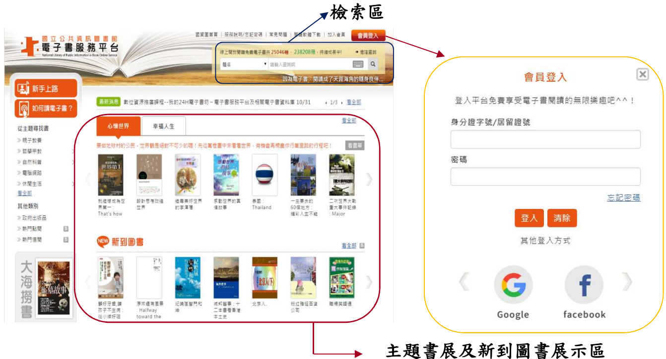
主題書展及新到圖書展示區