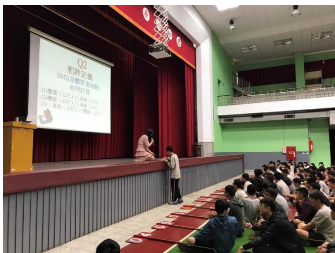
有獎徵答肥胖定義