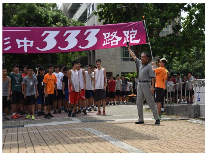
預備開跑-校長鳴槍