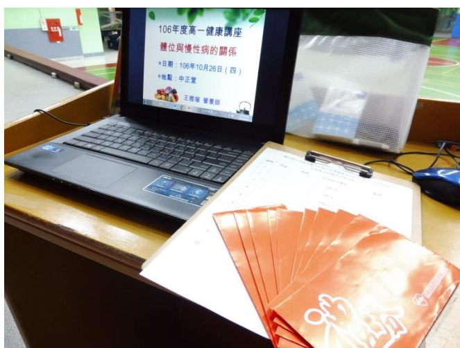
營養教育講座暨有獎徵答活動