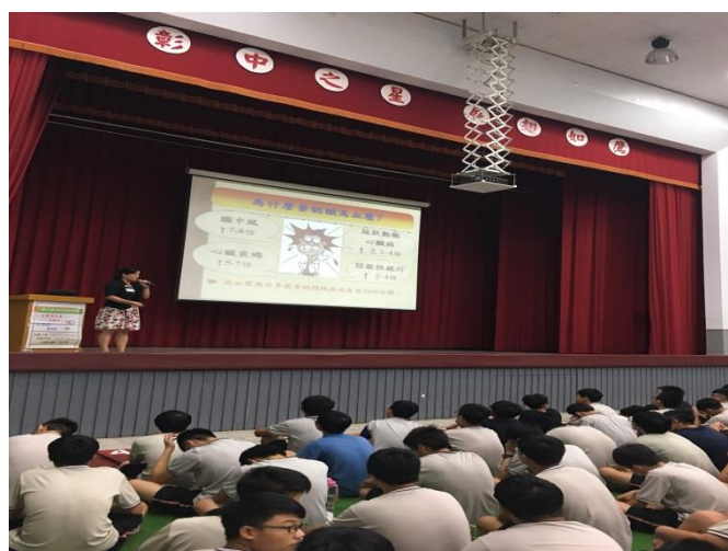
說明檢查異常原因