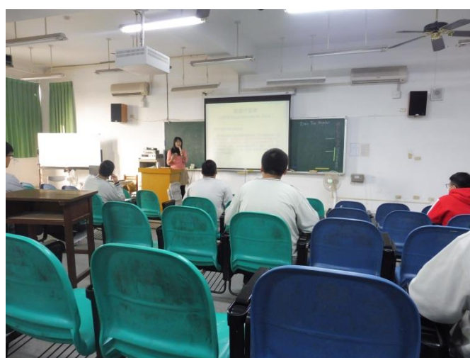
宣誓&教導如何填寫飲食記錄