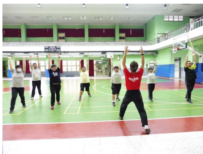
體育教師教導核心肌群