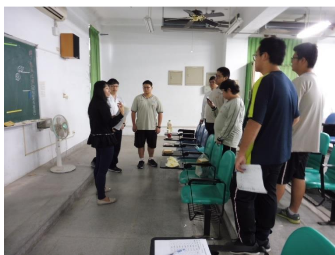
早餐熱量拆解課程