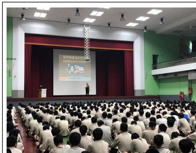
名稱：109.10.7 高一愛滋病防治宣導講座(衛生組長引言)