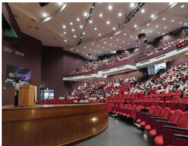
名稱：109.7.1 高一性侵害／性騷擾防治（兒童性侵害、約會強暴）宣導講座