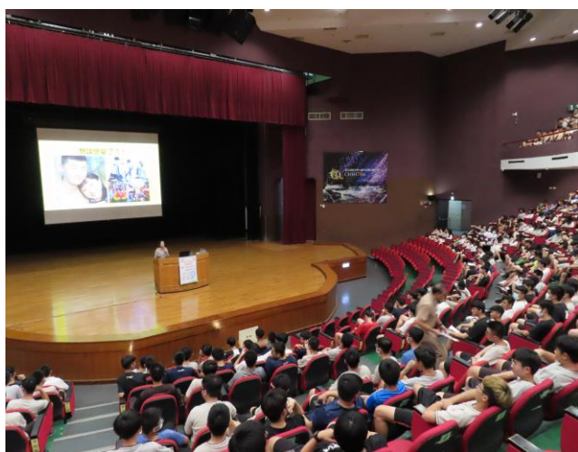
名稱：109.7.1 高二性侵害／性騷擾防治（兒童性侵害、約會強暴）宣導講座