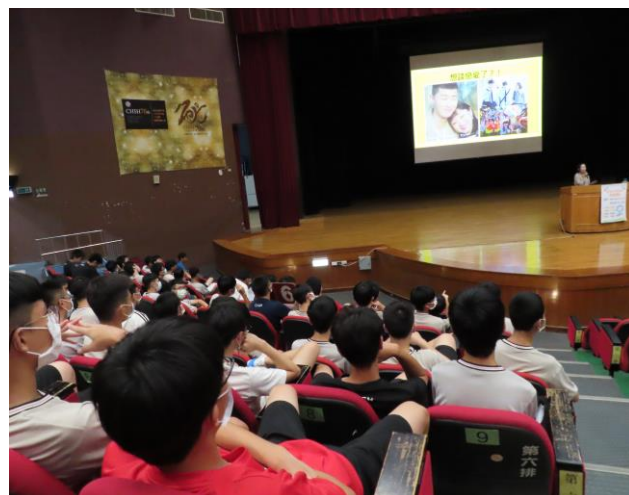
名稱：109.7.1 高一性侵害／性騷擾防治（兒童性侵害、約會強暴）宣導講座