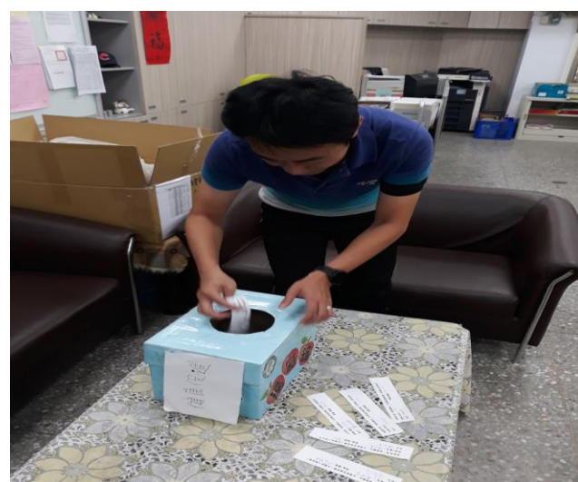
名稱：健康體位&心血管疾病防治有獎徵答活動題目抽獎