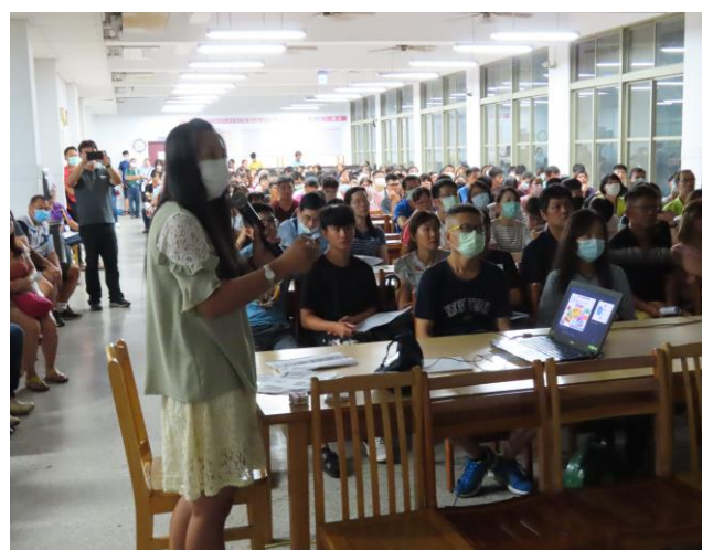
名稱:住宿生家長說明會進行健康飲食衛教宣導活動