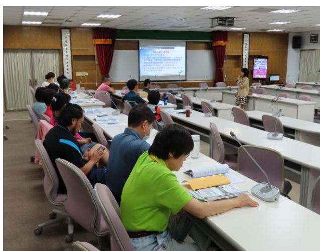
名稱：109.9.1 從案例談校園性別事件之處理 宣導講座（性平教育委員暨教職員工）