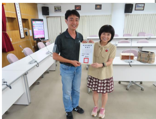
名稱：109.9.1 從案例談校園性別事件之處理 宣導講座（學務主任頒發感謝狀）