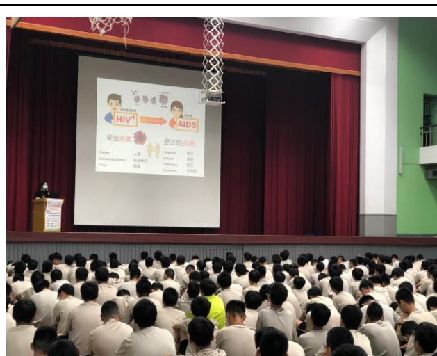
名稱：109.10.7 高一愛滋病防治宣導講座