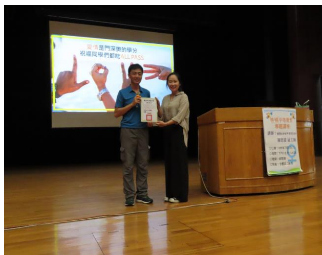
名稱：109.7.1 高二性侵害／性騷擾防治（兒童性侵害、約會強暴）宣導講座（學務主任頒發感謝狀）