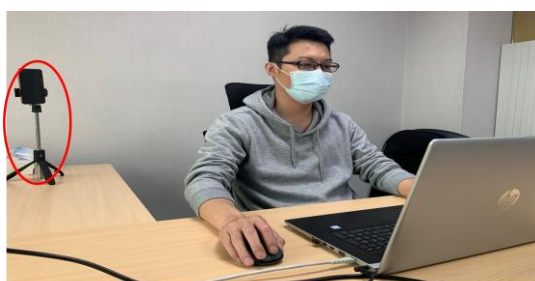
測驗期間需全程開啟視訊及麥克風，並將把手機放置於您坐定的座位斜後方的平台四點鐘或八點鐘方向