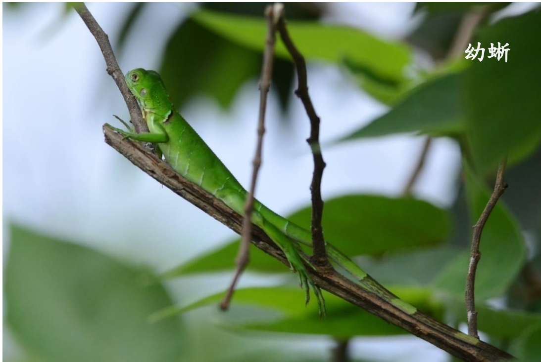
幼蜥： 吻肛長<18 公分，尚未性成熟，不易判斷性別。 雌雄性別： 吻肛長超過 20 公分時，較容易依外觀判斷。