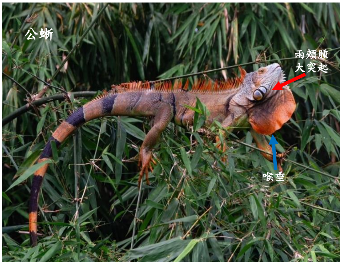
公蜥 鼓膜下鱗片大而明顯，且頭部 兩頰腫大突起 ，體幹背側棘狀頸脊鱗較長， 喉垂(dewlap) 亦較母蜥大。