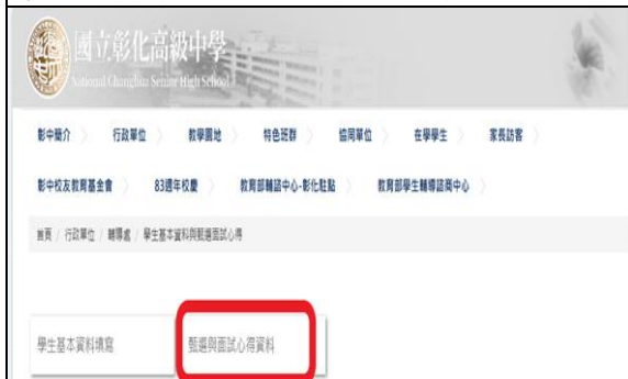
步驟三：甄選與面試心得