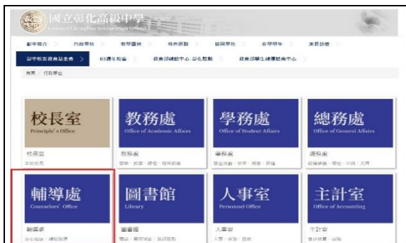
步驟一：學校首頁，點選輔導處