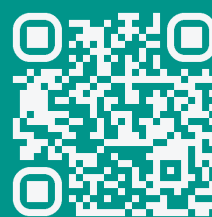
智慧機器人學程網頁