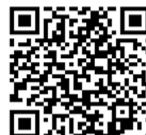
114年金融基礎教育推廣計畫

https://sites.google.com/view/twnposfinancialnew