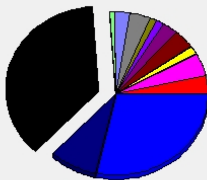
114年06月資產科目金額比例圖