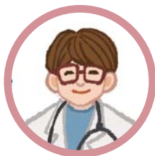
專家（司法詢問員、醫生、鑑定人等）

為被告辯護的辯護人，或是幫助你主張法律權利的告訴代理人，他們都是律師、都是法律專家。