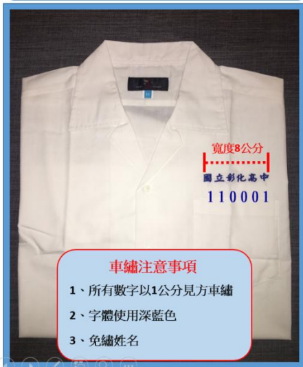
長、短袖白色制服學號車繡樣式