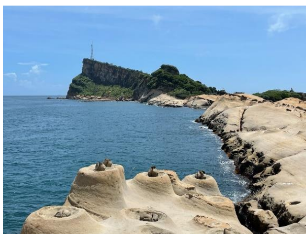
圖 1 台灣地景保育網任選一張地景的照片或自行拍攝或選用照片(請務必註明出處)